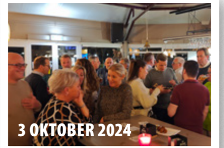
3 OKTOBER 2024

25 SEPTEMBER 2024 Dülkener Narrenakademie