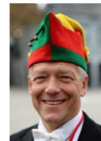
Oscar Vandenberg (KaRa / Jäög / Zeukkemie nui Tempelers) 't Batteraöfke / Minister vaan Energieke Zakes. 10 jaor.