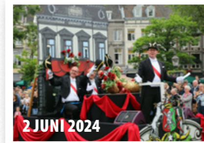
2 JUNI 2024