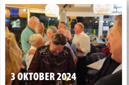
3 OKTOBER 2024

Börgermètwerkers-beer-en-bitterbal- le-bedaank-borrel