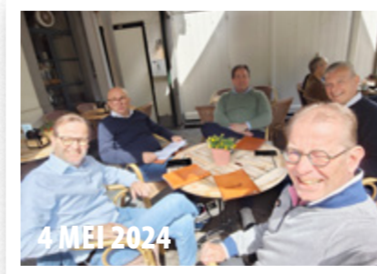
4 MEI 2024 Heidaag Tempeleersbestuur Geulemermeule