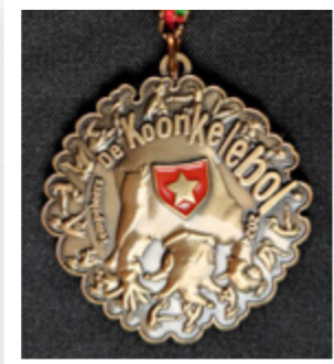
PRINSE-ORDE DE KOONKELEBOL 1372