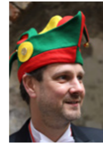
Berman Pooters (Merchandise / Trósjer / Gezèt / Rijaloetlunch) 't Ritseleerke / Minister vaan Nievelechte Zakes. 4 jaor.