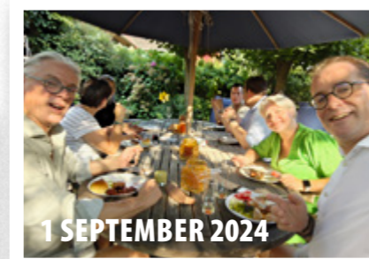
1 SEPTEMBER 2024