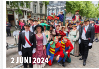
2 JUNI 2024