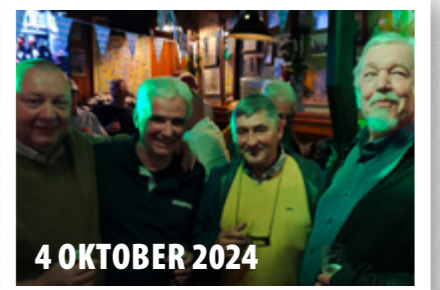
4 OKTOBER 2024

Börgermètwerkers-beer-en-bitterbal- le-bedaank-borrel